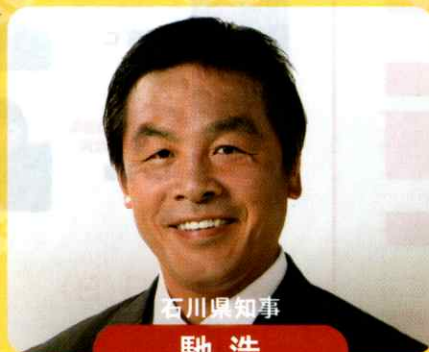
石川県知事 馳 浩