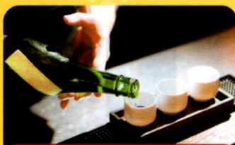
24種類の日本酒を御用意 無料の飲み比べ体験