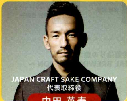
JAPAN CRAFT SAKE COMPANY 代表取締役 中田 英寿

1/25(土)14:00 ~ 「伝統的 酒造り」ユネスコ無形文化遺産登録記念スペシャル鼎談