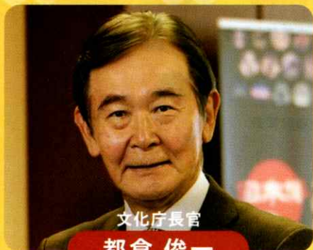
文化庁長官 都倉 俊一