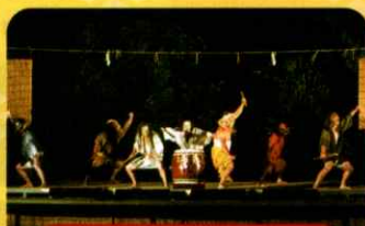
さまざまな 伝統芸能の披露