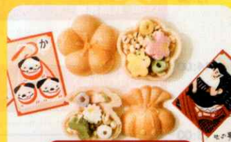
伝統工芸の 制作体験