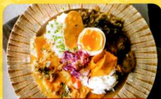
キッチンカーで 美味しい食体験