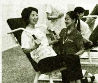
機械を使って 全身スッキリ