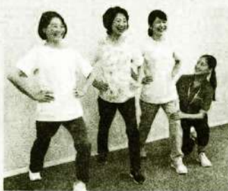
下半身らくらく ストレッチ