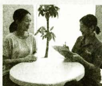
お体のお悩み のご相談もできます