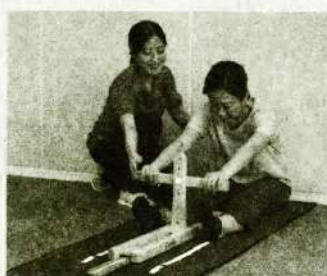
お体の状態を測定