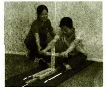
柔軟性をチェック