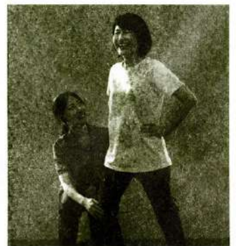
指導員がお体の状態を確認