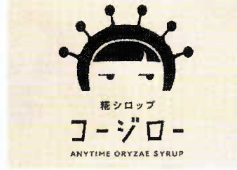
糰シロップコージロー