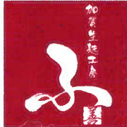
加賀生麩工房ふぜん