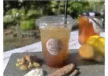
フルール・ド・オロル能登