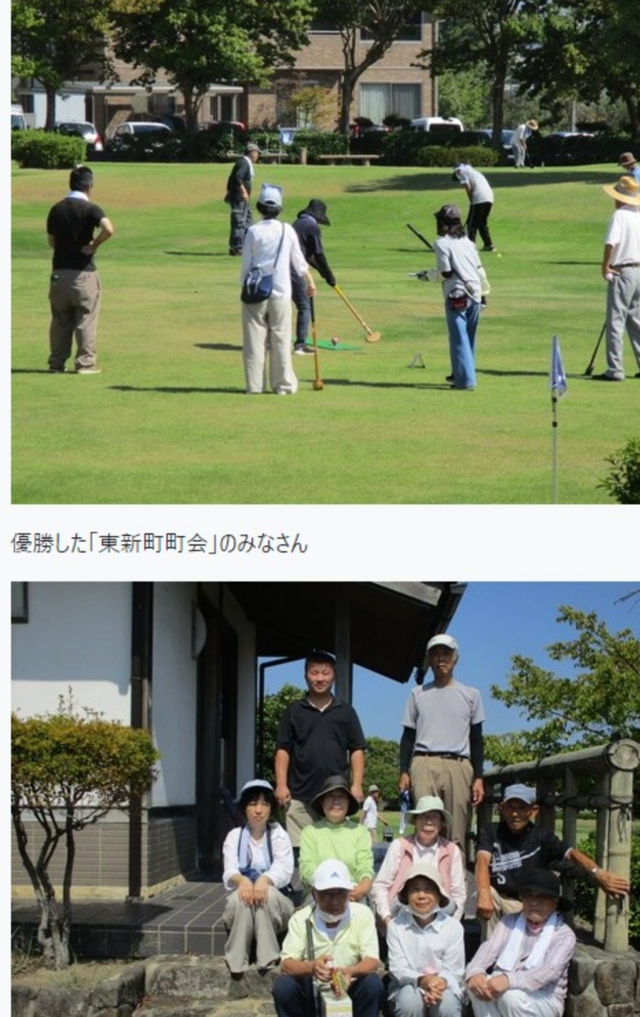
優勝した「東新町町会」のみなさん