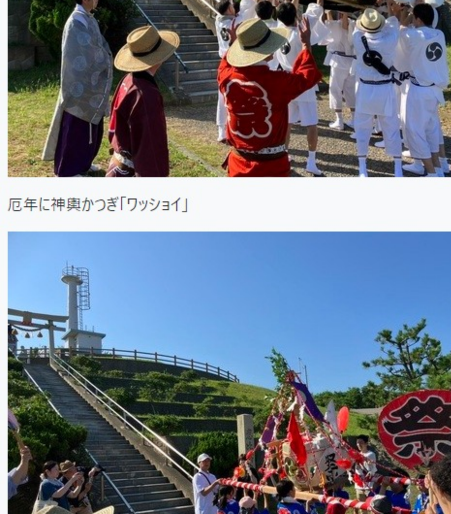
子どもホラホイ行列