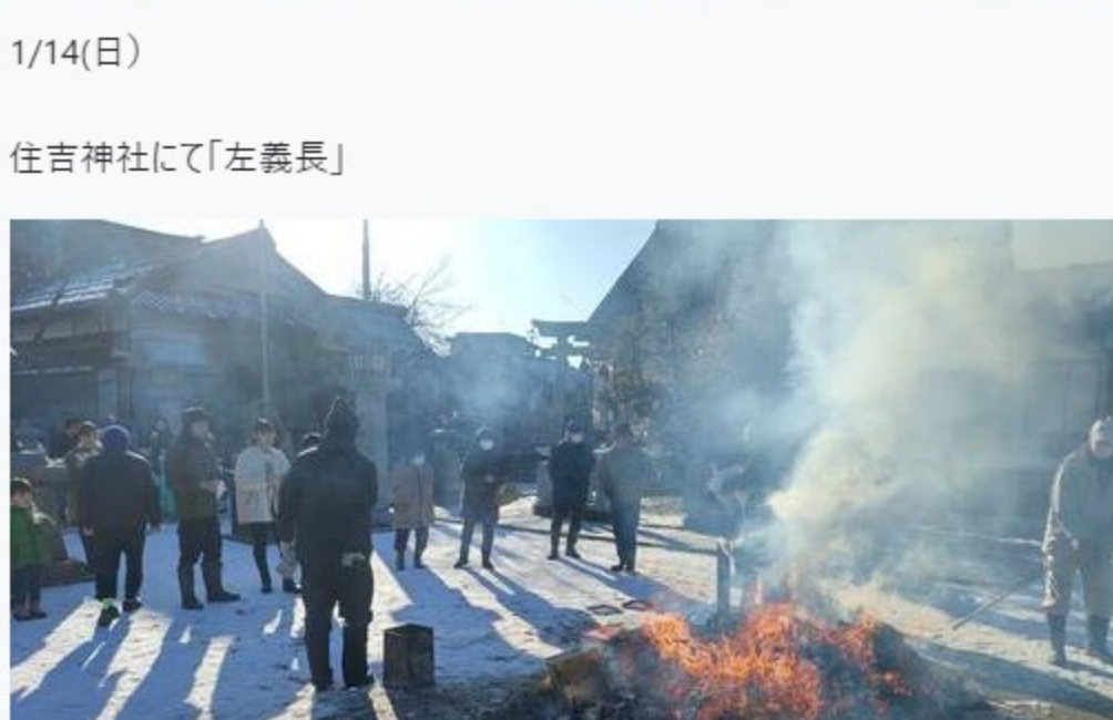
住吉神社にて「左義長」