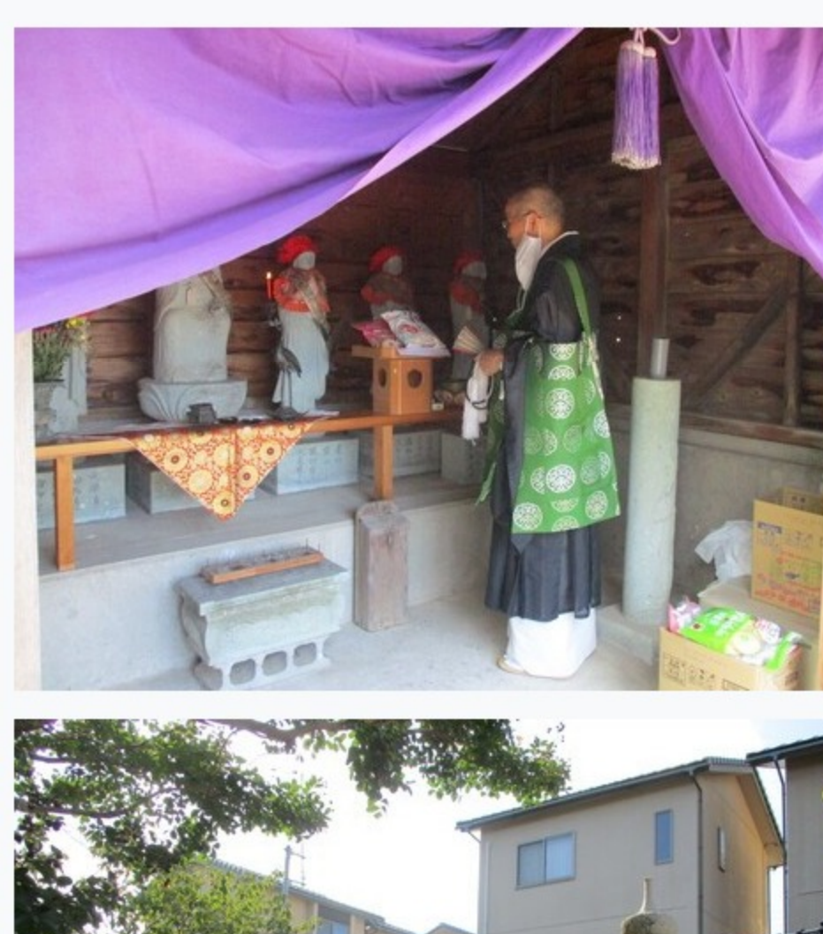
●8月20日(日)恵比須社祭り