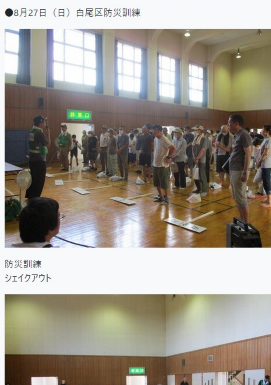
●8月27日(日)白尾区防災訓練