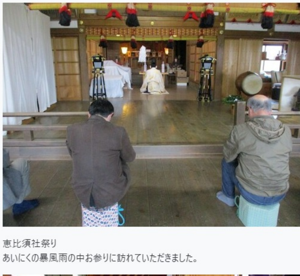
恵比須社祭り あいにくの暴風雨の中お参りに訪れていただきました。