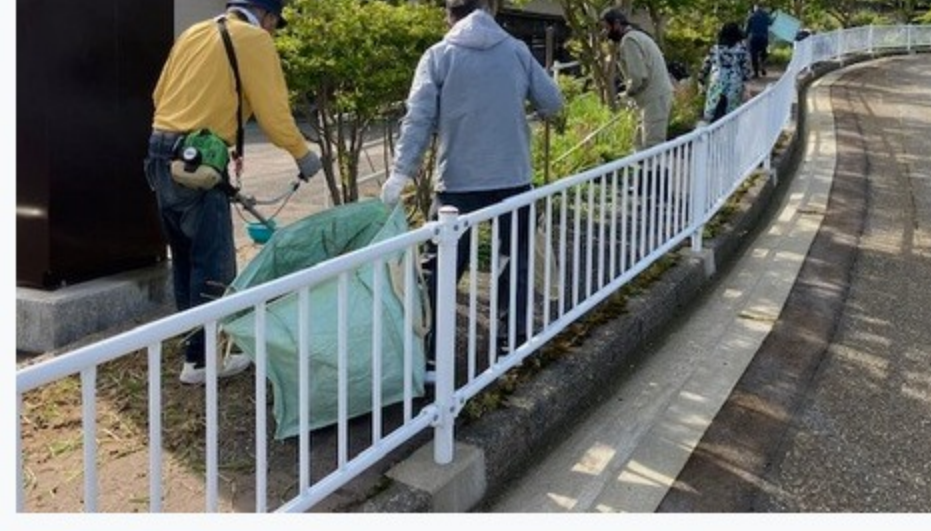
●鬼ヶ山公園花植栽活動(花いっぱい運動) 5月28日(日)午前9時、子供会、女性会、美化推進員等約40名で、マリゴールド、サルビア各100株を植栽