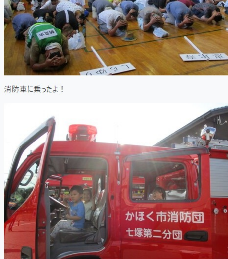
防災訓練 シェイクアウト