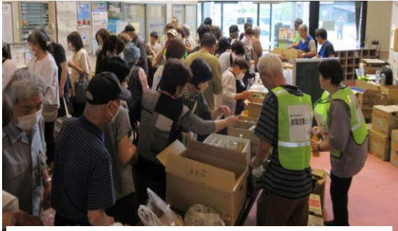
「無料食糧支援」など6回実施、七塚健康福祉センター(写真) 羽咋の共同センターと、かほく市が後援

大崎地域では液状化で地面の隆起や側方流動で、対策に5年～10年かかると深刻な被害が出ています。